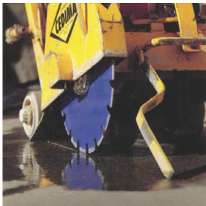
Oblika jedra diamantne krožne žage